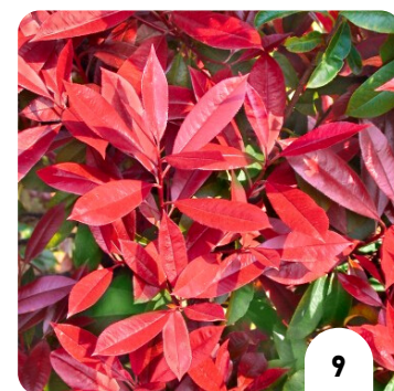
Red Robin Tosca